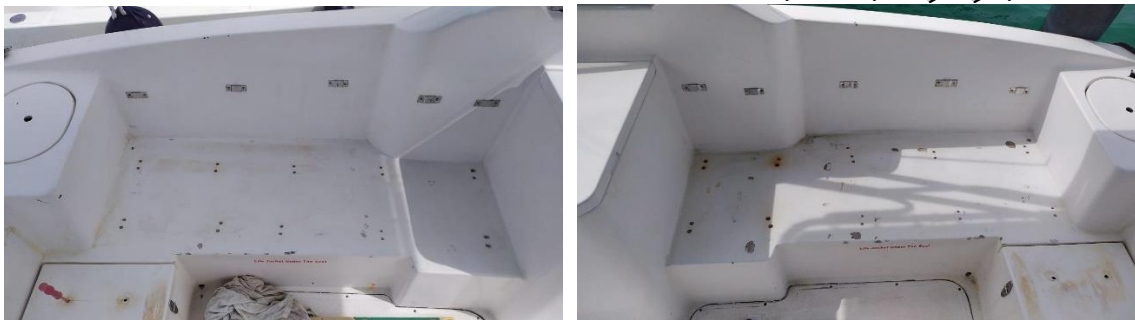
9. مهندسی ناوگان دریایی (و ناوگان دریایی) و ناوگان دریایی و ناوگان دریایی