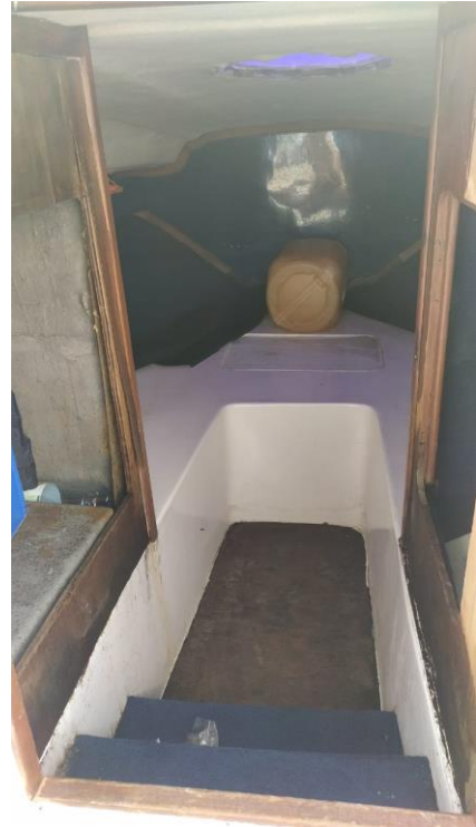
8. مهندسی ناوگان دریایی و ناوگان دریایی، مهندسی ناوگان دریایی و ناوگان دریایی.