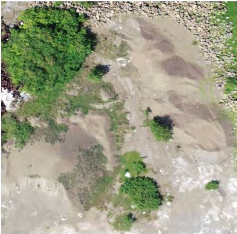
RIVER SAND PILE