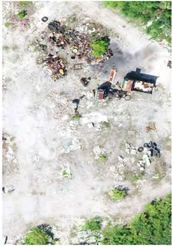
VEHICLES AND SCRAP METAL