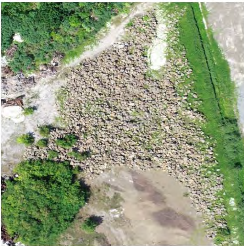
ROCK BOULDER PILE