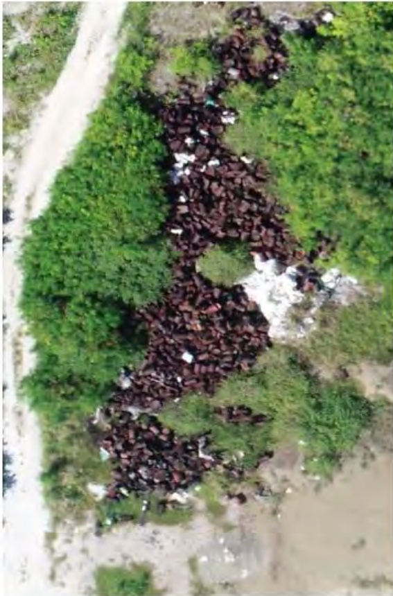
EMPTY OIL DRUMS